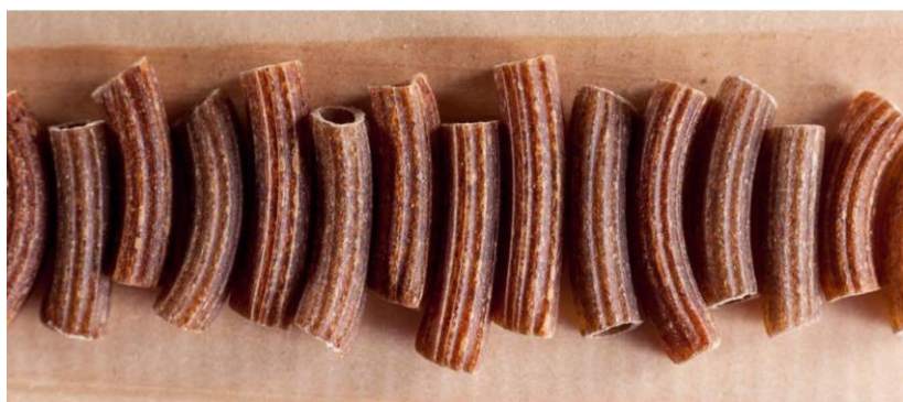
Рис. 2. Образцы макаронных изделий из цельносмолотого зерна пшеницы

Во время обработки муки большая часть питательных веществ, таких как незаменимые аминокислоты, минералы и витамины, удаляется из зерен пшеницы (рис. 3).